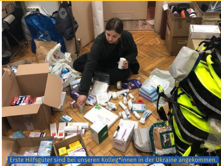
Erste Hilfsgüter sind bei unseren Kolleg*innen in der Ukraine angekommen.